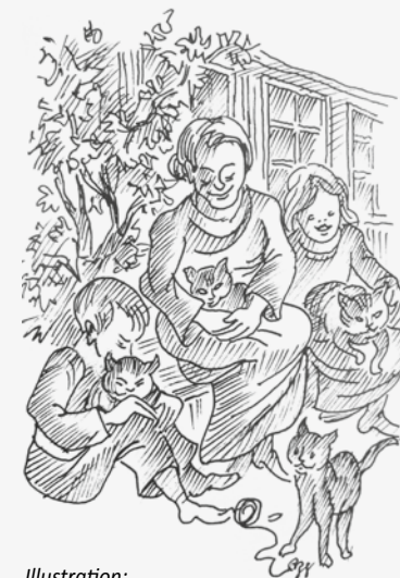
Illustration: Ernst Bänziger

D Pest häd me gfürcht wie nöd gad näbis, wil me dere Süüch hülflos uusgliferet gsi ischt. O z Wolfthalde häds schaarewiis Riichi ond Aarmi, Aalti ond Jungi troffe. Gad omm s Hus vo Lutzes im Högli häd de Schwarz Tod en groosse Boge gmacht.