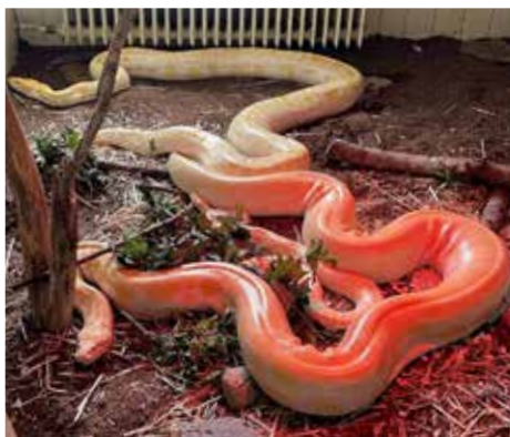
Schlangenhaltung im Wohnzimmer.

deshalb neu beantragt werden. Zusätzliche Wochen verstreichen; dann wird der definitive Termin auf den 4. November festgelegt. Die Schlangen werden ausgiebig gefüttert, denn so sind sie wesentlich ruhiger und nicht angrifflich. Die Auflagen vom Zollamt sind umfangreich und die Sicherheitsvorkehrungen gross. Eine Bärenkiste vom Tierpark Goldau wird für die beiden Riesenschlangen in einem Pferdeanhänger bereitgestellt und mit Heizung und Kameras ausgestattet.