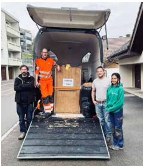
Der Transport ist bereit.

Der Alltag der Auffangstation in München zeigt eindrücklich, mit welchen Herausforderungen die Pfleger:innen und die Station heutzutage konfrontiert sind. Seien es die überforderten Reptilienhalter:innen, die zahlreichen Beschlagnahmungen oder die Abgabe von Tieren aus privater Haltung. Der Strom ist derzeit sehr teuer und die Haltung von Reptilien erfordert einen hohen Energieaufwand.