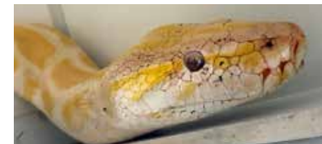
Die beiden Tigerpythons in tierärztlichen Pflege in der Auffangstation München.

sie trotz allen Bemühungen eingeschläfert werden mussten. Gemäss Bericht wies ihre Haut Verbrennungsspuren auf (vermutlich von offenen Heizkörpern), ihre Schuppen waren verletzt oder von Bakterien befallen. Viren haben den Tieren arg zugesetzt und ihre Lungen waren so krank, dass jede weitere Behandlung nur weiteres Leid für die Tiere bedeutet hätte. Offenbar waren die Tiere durch die schlechte Haltung schon länger krank. Bakterien und Viren schlummern in diesen Tieren oft lange unbemerkt - eine medizinische Beurteilung ist bei lebenden Reptilien ohne Fachmediziner:innen kaum zu gewährleisten. Wir haben für die beiden Pythons so viel unternommen, soviel von ihnen gelernt und uns so viel erhofft. Nicht nur aufgrund dieser Erfahrung sehen wir die private Haltung von Reptilien oder Exoten als höchst problematisch an. ▲